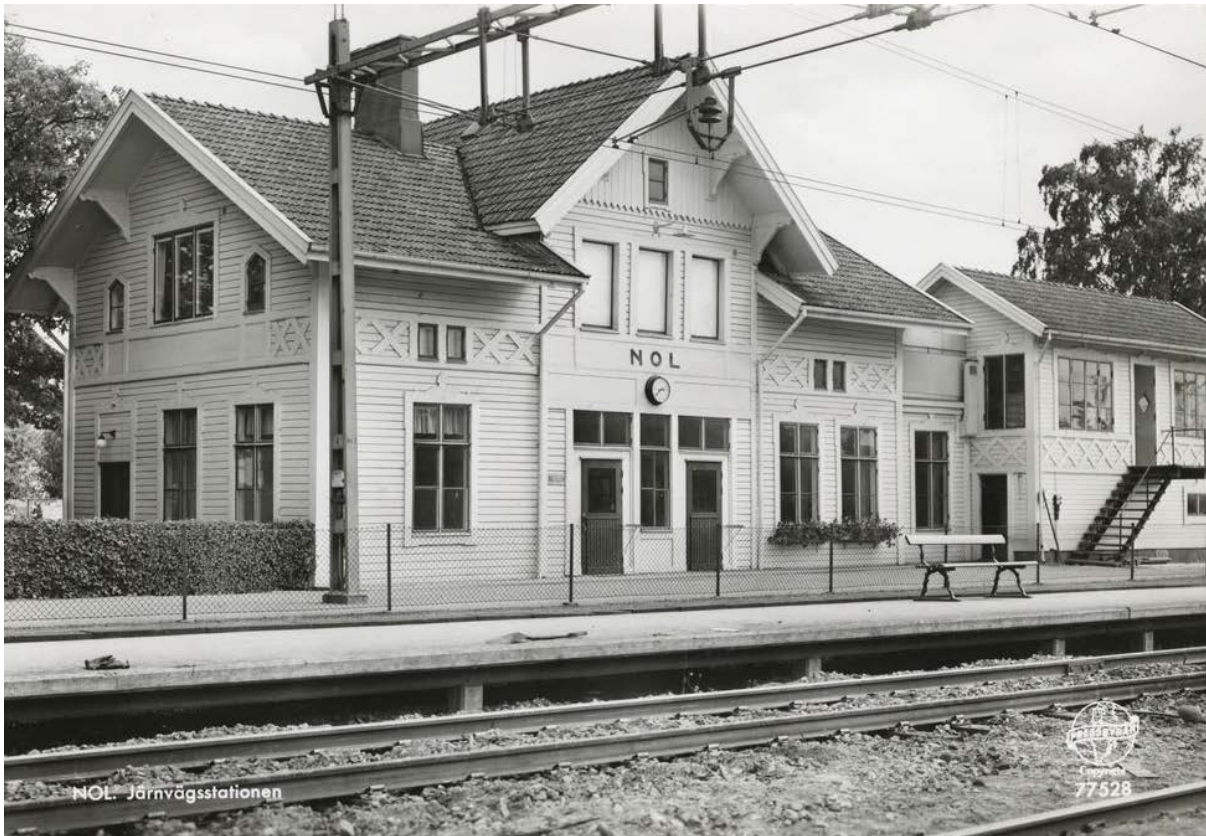
Nol station sannolikt tidigt 1960-tal