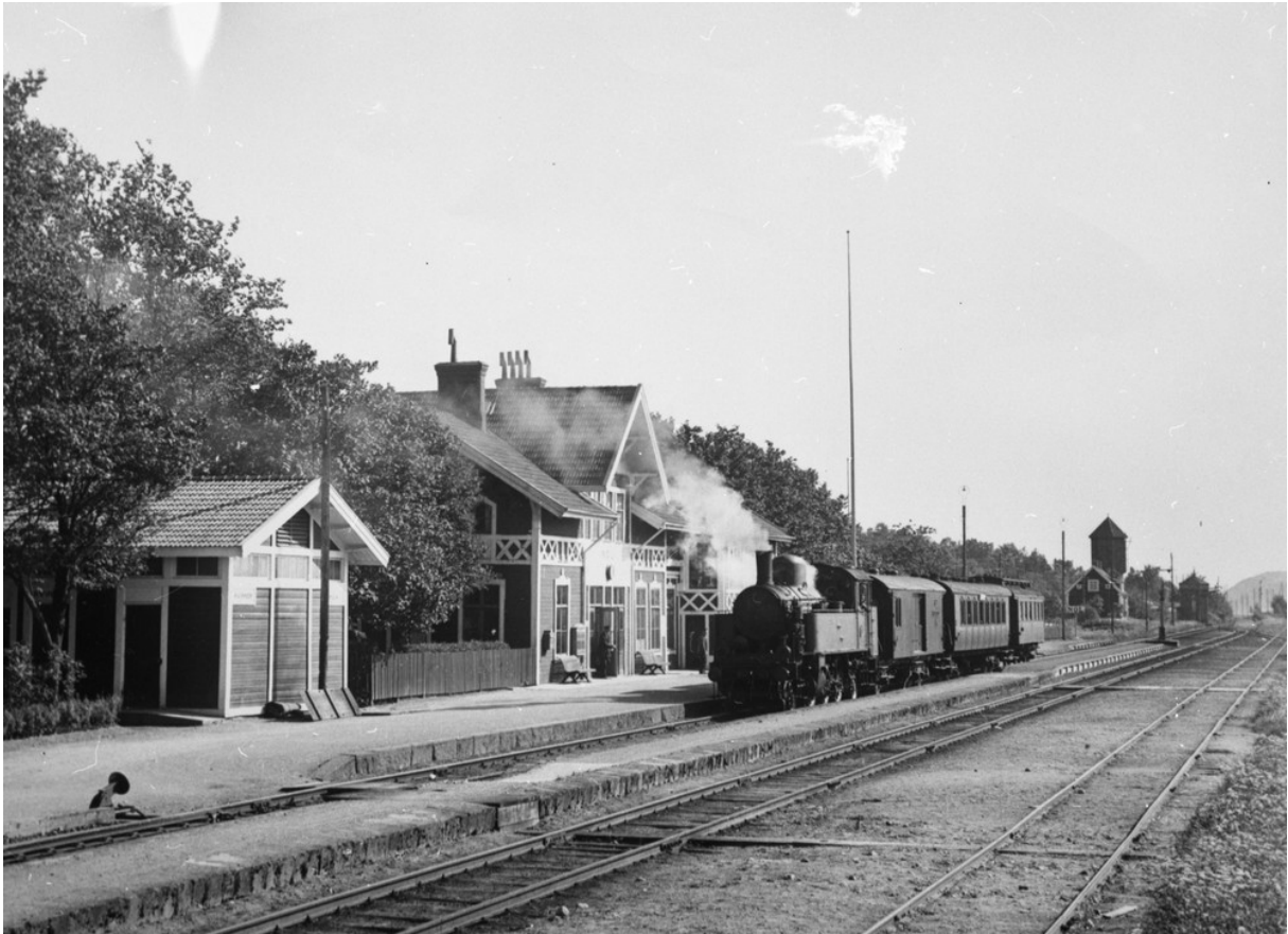
Nol station 1915